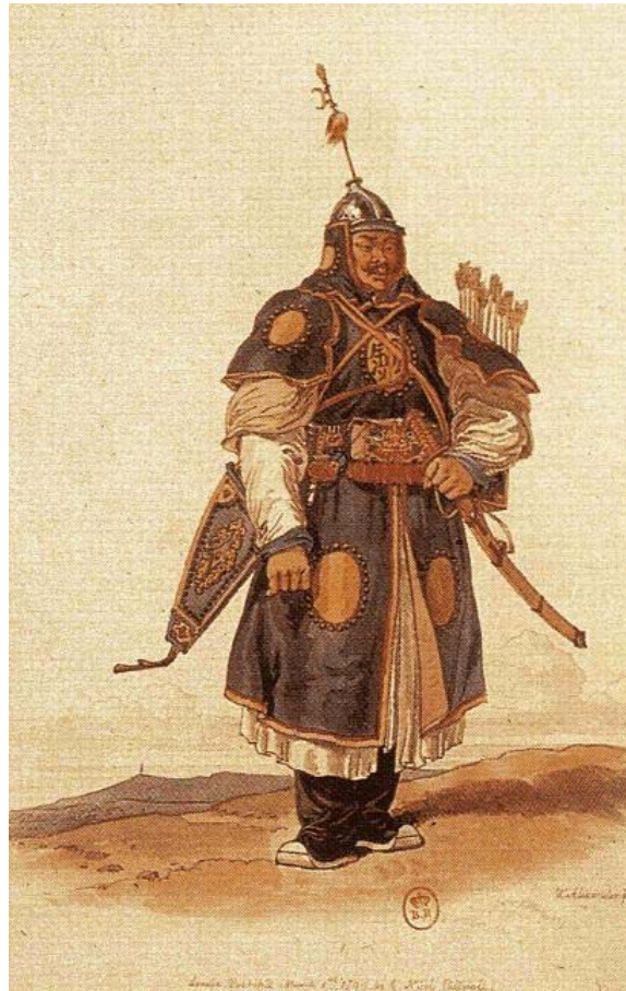
Bộ binh nhà Thanh