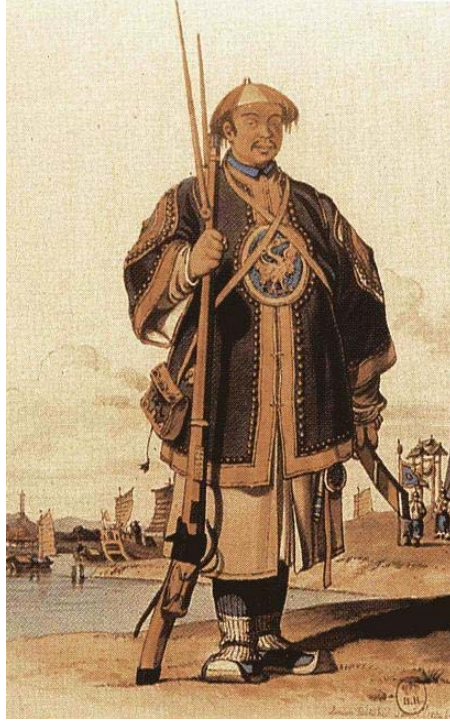
Xạ thủ nhà Thanh (cầm súng điều thương, có nạng chống)

The Collision of two Civilisations, phụ trang 282-283