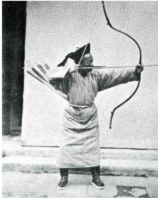
Xạ thủ (Thanh) khoảng 1870

Cung thủ khi đó vẫn còn trên lưng ngựa liền lớn tiếng xưng danh tính của mình, sau đó xuống ngựa trao dây cương cho người khác. Nếu trong khi thi bắn, người đó bắn trượt hoặc rơi mũ hay té xuống ngựa thì sẽ bị coi như không đúng cách (thất nghi - 失儀) và bị loại ra khỏi các kỳ thi ngoại trường. Thí sinh xuống ngựa tay vẫn cầm cung trình diện trước khảo quan đứng ở đằng cuối trường bắn. Y cúi chào, báo danh một lần nữa, và cung kính lui về. Việc đó tiếp diễn cho tất cả các thí sinh trong nhóm, và rồi tới nhóm thứ hai và sau nữa đến khi hoàn tất.