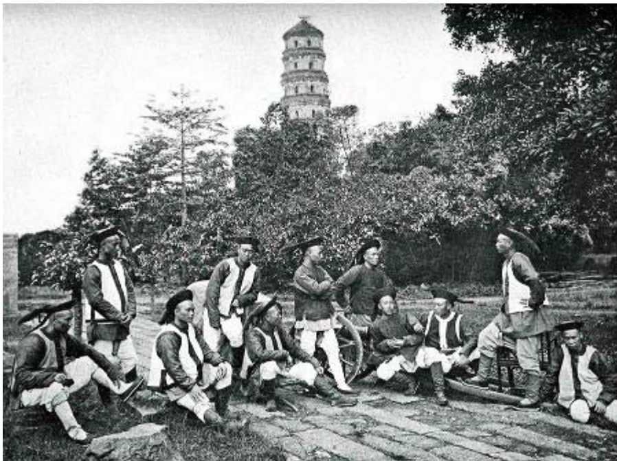
Kỳ binh nhà Thanh

Những con số đó dường như để thoả mãn điều chúng ta muốn nói hơn là đi sát thực tế của tình hình. Trong khi đó, hành trạng và vai trò của các tướng lãnh nhà Thanh lại ít ai để ý.