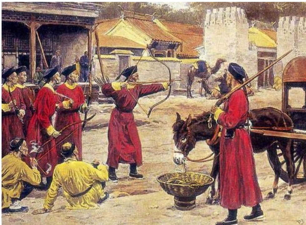
Quân Thanh tập bắn trên đường ở Bắc Kinh

Tranh rút ra từ The Graphic Magazine năm 1878